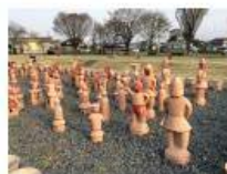
大信寺 忠長の墓 かみつけの里