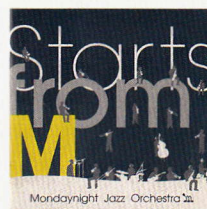
Starts from M