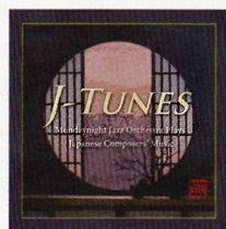
J-TUNES Mondaynight Jazz Orchestra Plays Japanese Composers' Music