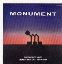
MONUMENT OUR FAVORITE SONGS